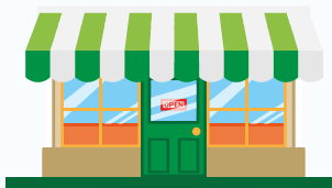
PRODUÇÃO DE NOVOS PRODUTOS

As matérias primas recicladas geram novos produtos , que voltam ao mercado para consumo, fechando o ciclo!