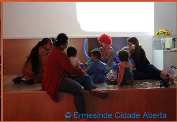
Ermesinde Cidade Aberta