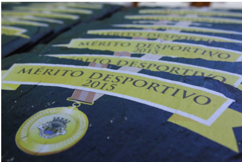
▲ Gala de Mérito desportivo de Valongo