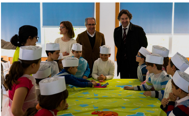
▲ DiverCook: Sessões temáticas para promover a alimentação saudável