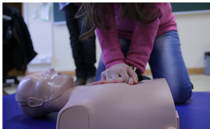
▲ Formação em suporte básico de vida para todos os alunos do 9º ano