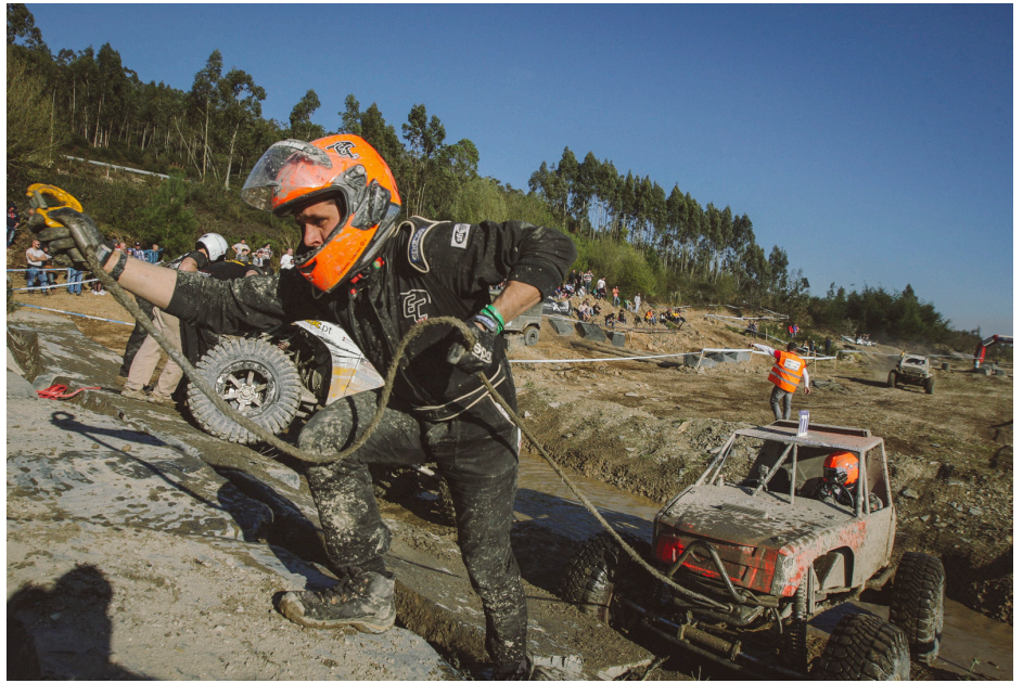
▲ Campeonato Nacional de Trial 4x4 · Valongo