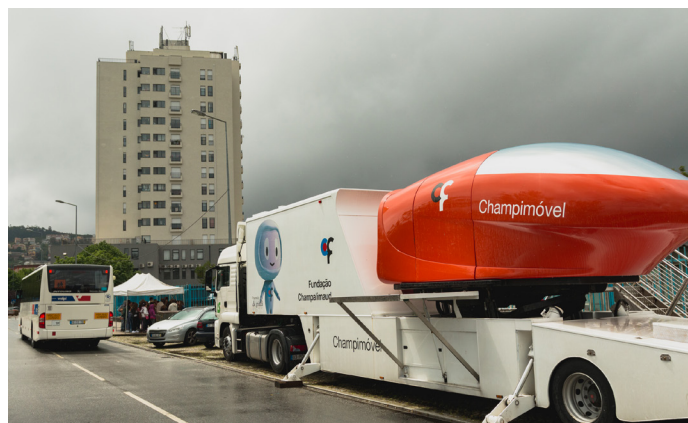
▲ Champimóvel: Viagem interativa ao interior do corpo humano