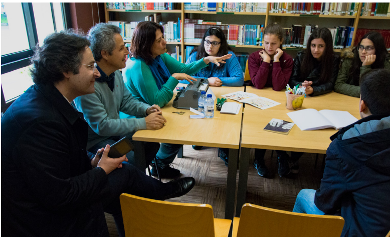
▲ Biblioteca Humana: Pessoas atuam como livros protagonizando os estereótipos que se pretende desconstruir

O PEM foi desenvolvido em parceria com as escolas e restantes instituições locais. Esta articulação visa evitar a fragmentação, duplicação e dispersão de iniciativas e projetos, numa lógica de racionalização de recursos, bem como contextualizar e integrar projetos e programas já existentes.