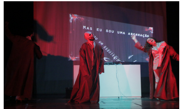
▲ Atos de Intervenção: desconstrução de estereótipos e eliminação da discriminação