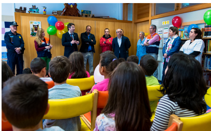
▲ Sessões de sensibilização da Proteção Civil