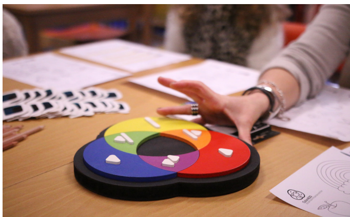
▲ Coloradd: Rastreio de daltonismo e acuidade visual