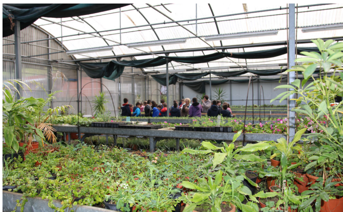
▲ À descoberta das Plantas: Visitas e atividades guiadas ao Horto Municipal da Palmilheira