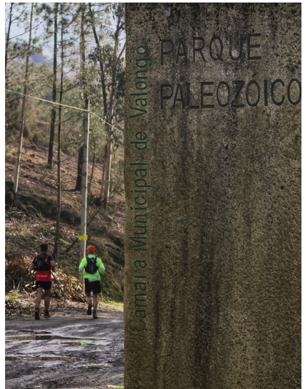
▲ Trilhos do Paleozóico · Valongo