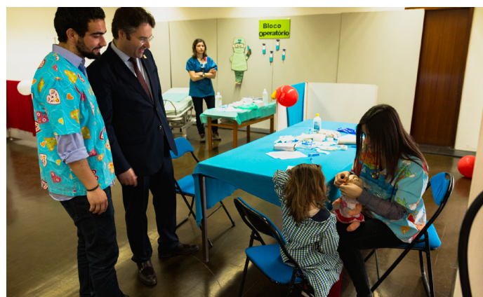
▲ Hospital dos Pequenos