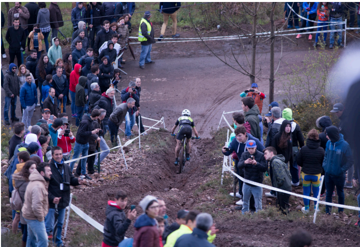
XCO Internacional · Sobrado ▲