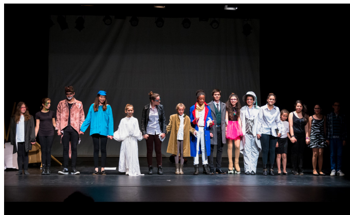
▲ Palco Letivo: Teatro Escolar