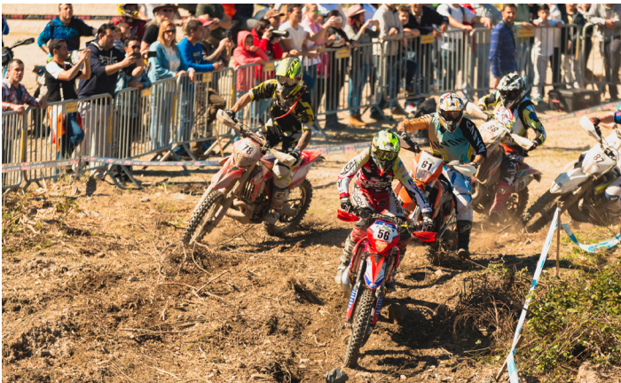
▲ Campeonato da Europa de Enduro · Valongo