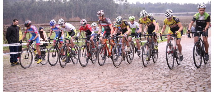
Ciclocross Internacional de Valongo · Sobrado ▶