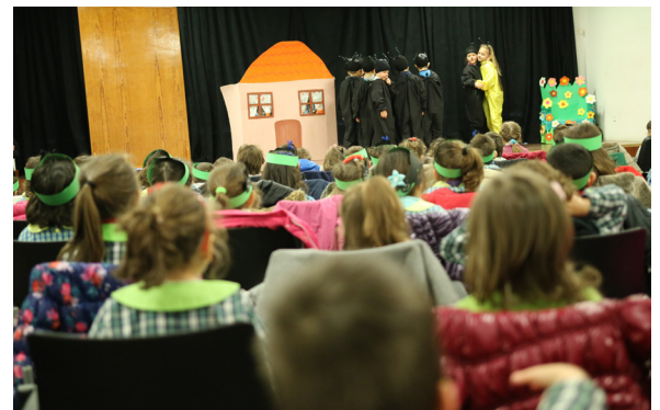
▲ Hora do Conto: Dramatização de contos infanto-juvenis para promover o livro e a leitura