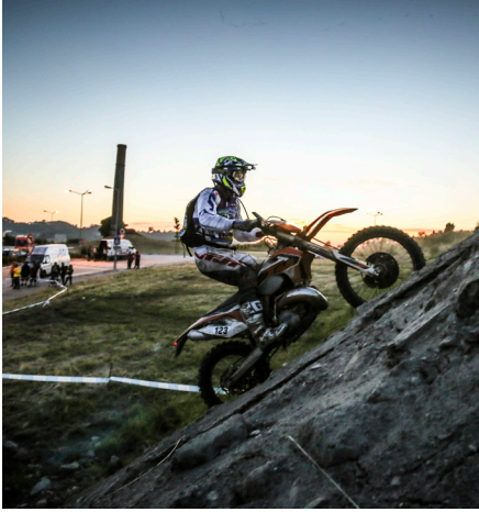
▼ Extreme XL Lagares · Valongo