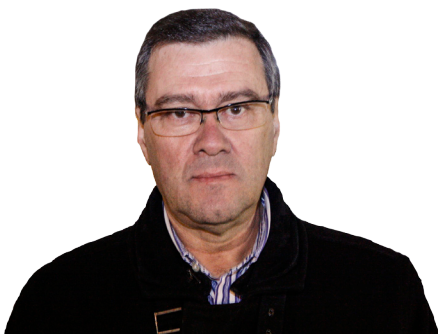
ABÍLIO VILAS BOAS

PRESIDENTE DA ASSEMBLEIA MUNICIPAL DE VALONGO