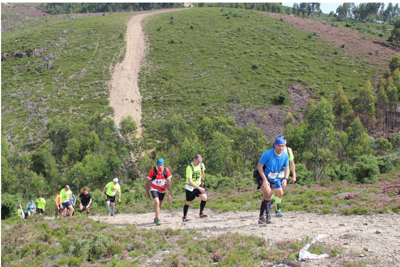
▲ Trail dos 4 Caminhos · Alfena

Fruto deste esforço, o Município de Valongo tem cada vez mais atletas federados com campeões e campeãs em diversos escalões e modalidades. O reconhecimento do mérito dos atletas concelhios é reconhecido anualmente na Gala do Desporto.