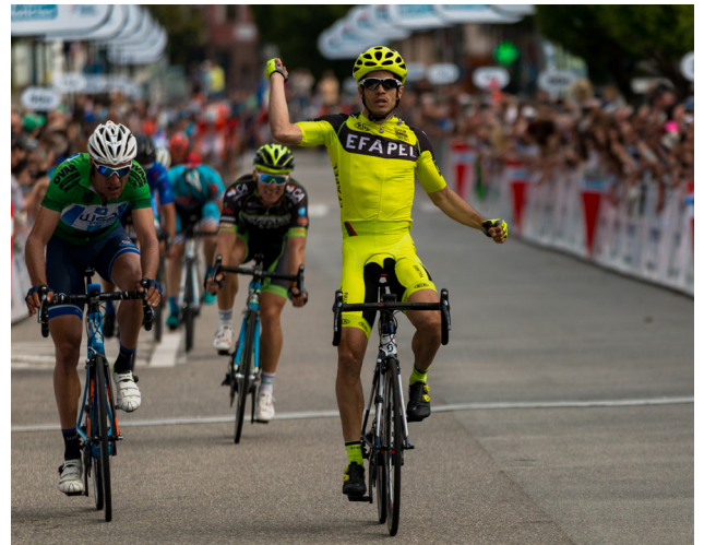
Grande Prémio de Ciclismo JN · Valongo ▲